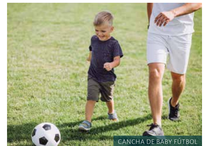
CANCHA DE BABY FÚTBOL

Santa Augusta le ofrece una variedad de panoramas inigualables, desde la simpleza de deleitarse con la belleza y frescura del océano pacífico desde la comodidad de su terraza, hasta aventurarse a explorar el entorno y sus múltiples atracciones y actividades.